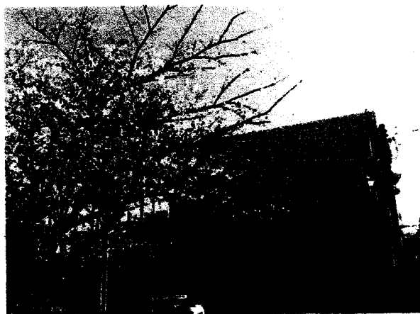
書空に映える校舎と桜

春休みに、この品濃のまちをふらりと歩いてみました。駅前のにぎやかさと落ち着いた閑静な住宅地、そして旧東海道にまつわる歴史の名残もあるすてきなまちだなと感じました。そしてそこに過ごす子どもたちの姿に思いをさせ、この地で共に学べるのが楽しみになりました。4月7日、新1年生95名を迎え、全校児童578名で令和8年度が始まります。